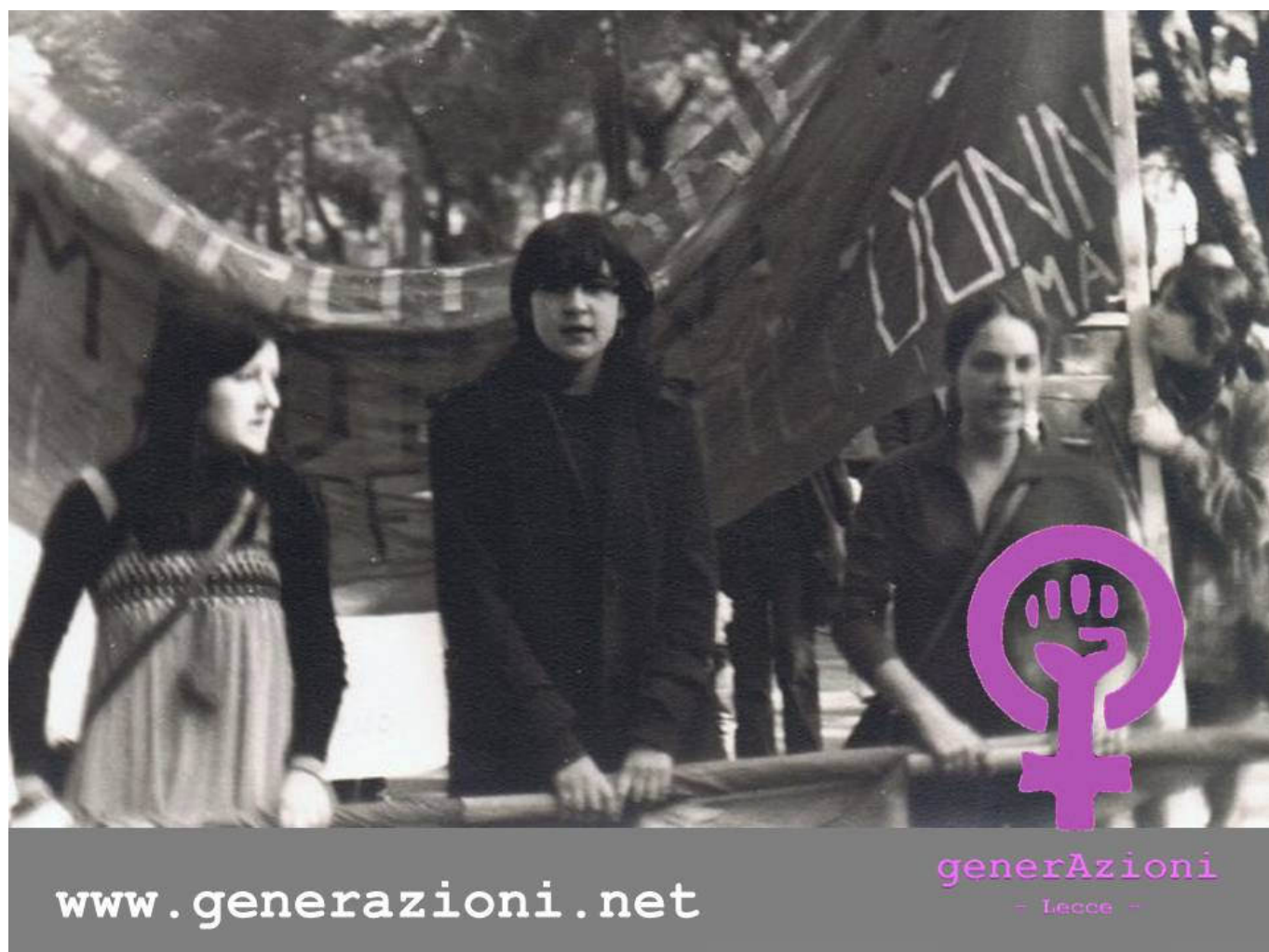
foto del corteo