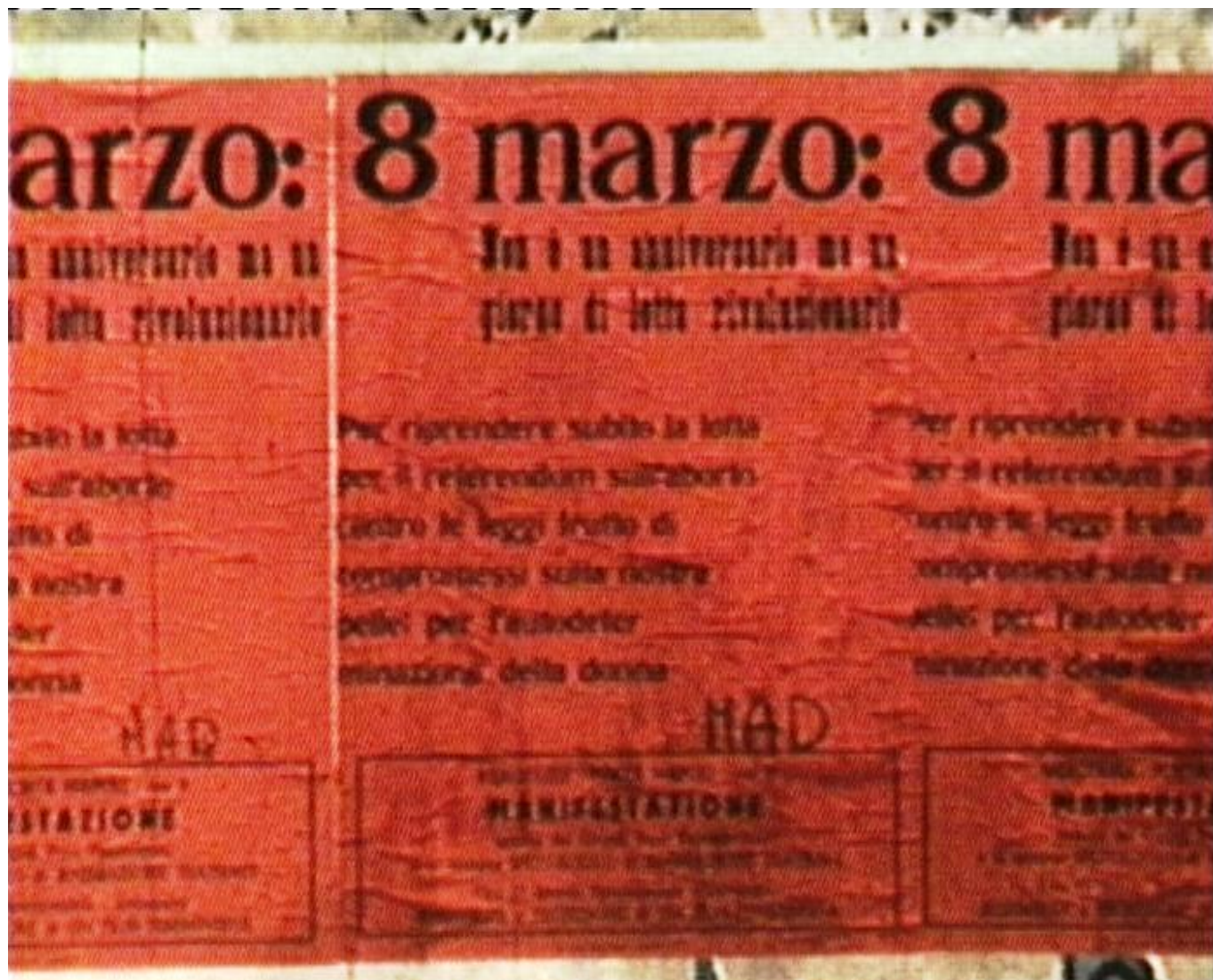
Gli avvisi di convocazione degli attivi